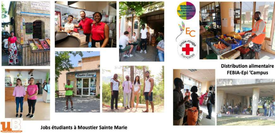
Distribution alimentaire FEBIA-Epi 'Campus